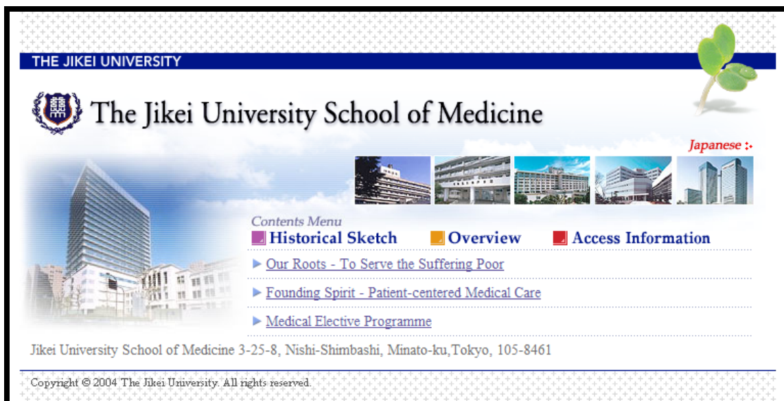
Foto 3. The Jikei University School of Medicine