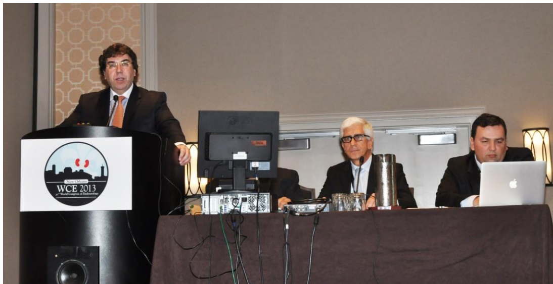
Foto 29. Prof.dr. Jean de la Rosette (Amsterdam, The Netherlands) în timpul susținerii posterului MP28-15.

Lucrarea a fost prezentată de prof.dr. Jean de la Rosette (Amsterdam, The Netherlands). (Foto 29 și 30)