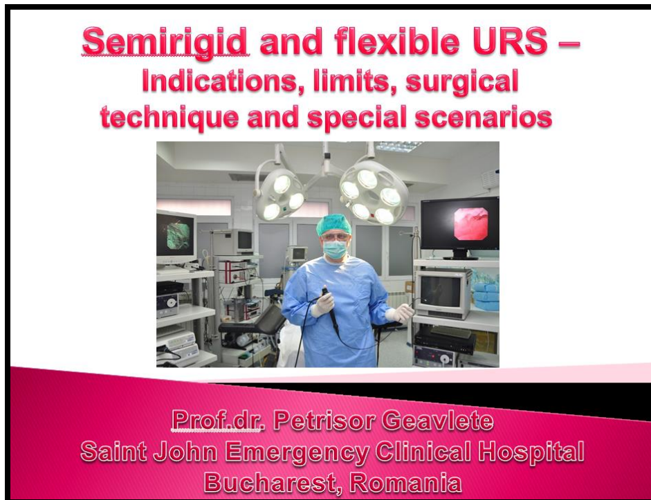
Foto 34. Prezentarea (primul slide) prof. P.Geavlete: Semirigid and flexible URS – Indications, limits, surgical technique and special scenarios.

Prezentarea prof. P.Geavlete a fost axată tocmai pe această tematică. (Foto 34, 35 și 36)