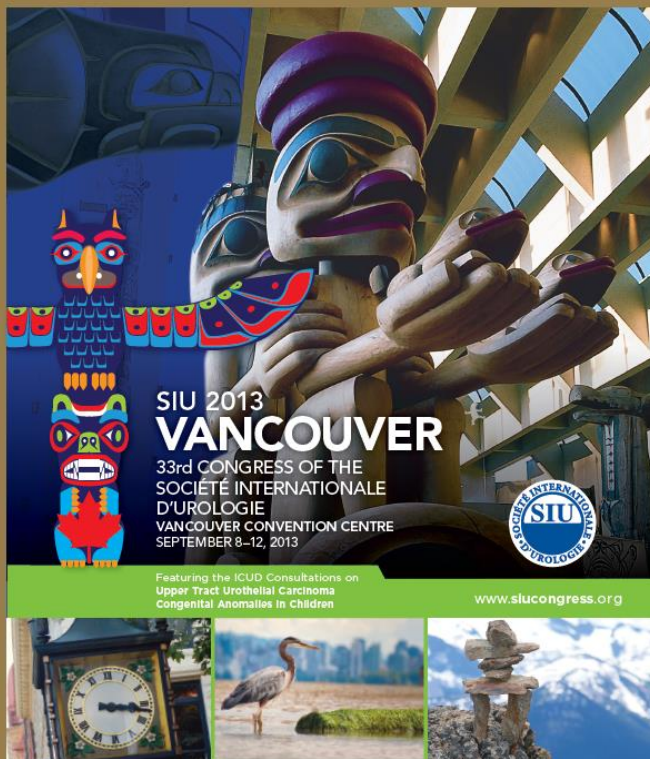
Foto 32. Urology, Volumul 82, 3 Supplement 1, September 2013.

În acest program au fost trecute toate cele 10 lucrări (9 personale și unul în colaborare cu alți autori străini) în care au fost menționați unii membrii ai clinicii de urologie din spitalul clinic de urgență Sfântul Ioan București.